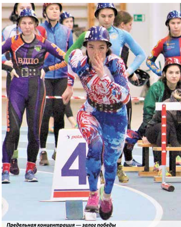
Предельная концентрация — залог победы

Скажите, пожалуйста, почему вы не занимаетесь физической культурой, спортом? Вы можете дать несколько ответов (%)