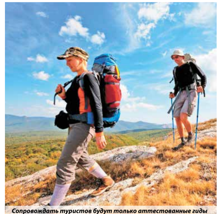
Сопровождать туристов будут только аттестованные гиды

Принятие закона будет способствовать повышению