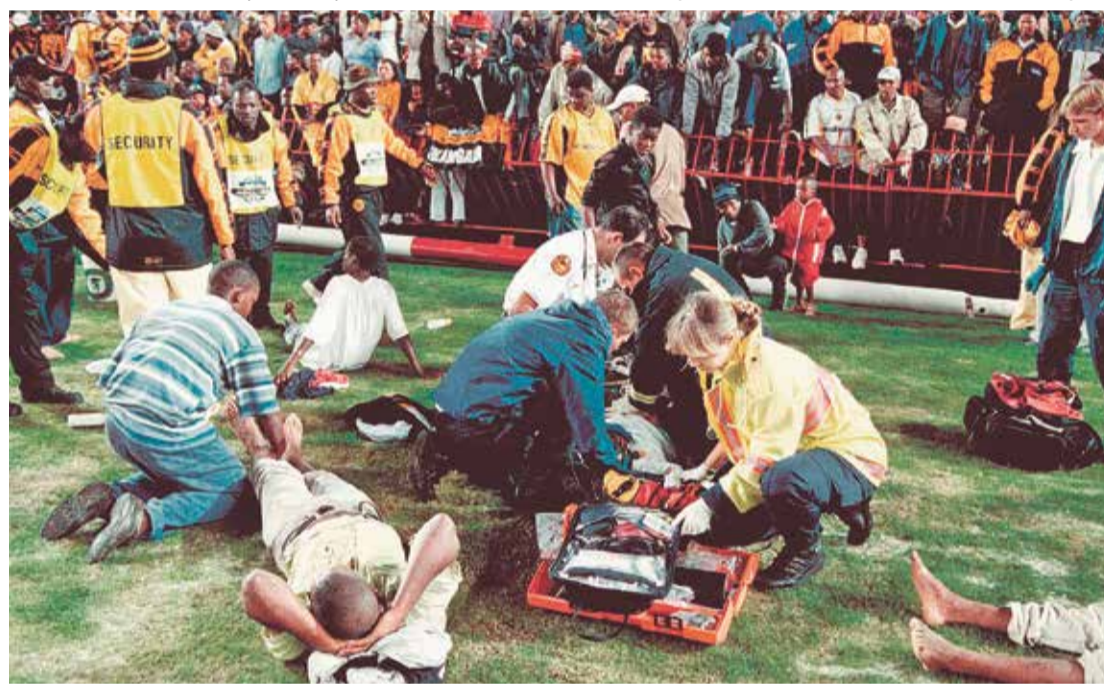
Прямо на газоне футбольного поля был развернут пункт первой помощи пострадавшим в давке

эти команды встретились в товарищеском матче на стадионе городка Оркни. Маленький провинциальный стадион явно не был приспособлен к наплыву фанатов, желавших поболевать за своих кумиров, из-за чего там возникла давка, приведшая к гибели 42 человек.