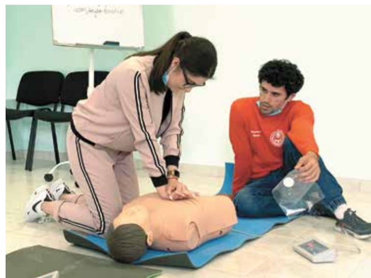
Отработка с добровольными спасателями действий по оказанию первой помощи

У нас выстроено отличное взаимодействие с Главным управлением МЧС России по РСО — Алания и региональным Комитетом по делам молодежи, которые являются нашими стратегическими партнерами. С момента создания ресурсного центра мы провели уже бо-