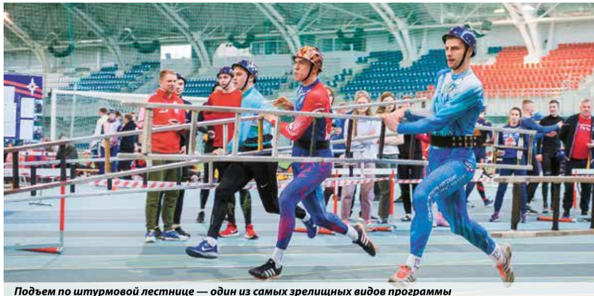
Подъем по штурмовой лестнице — один из самых зрелищных видов программы

Наталья Тихонова, пресс-служба Центра физической подготовки и спорта МЧС России