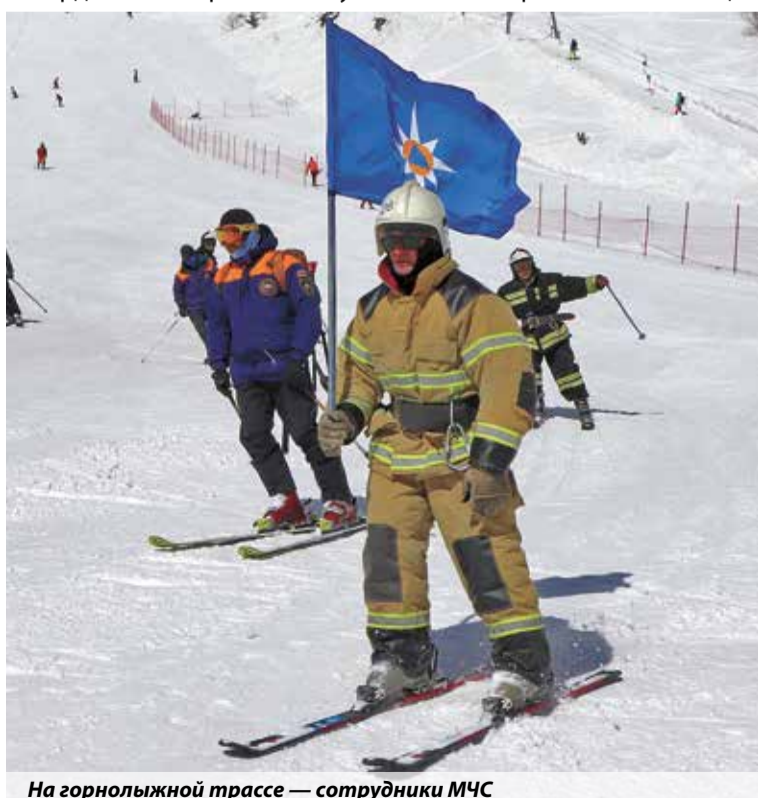
На горнолыжной трассе — сотрудники МЧС

Кантемир Беров, пресс-служба ГУ МЧС России по КБР