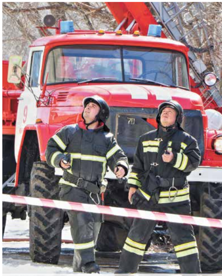
Задачей пожарных было не допустить огонь на крышу здания