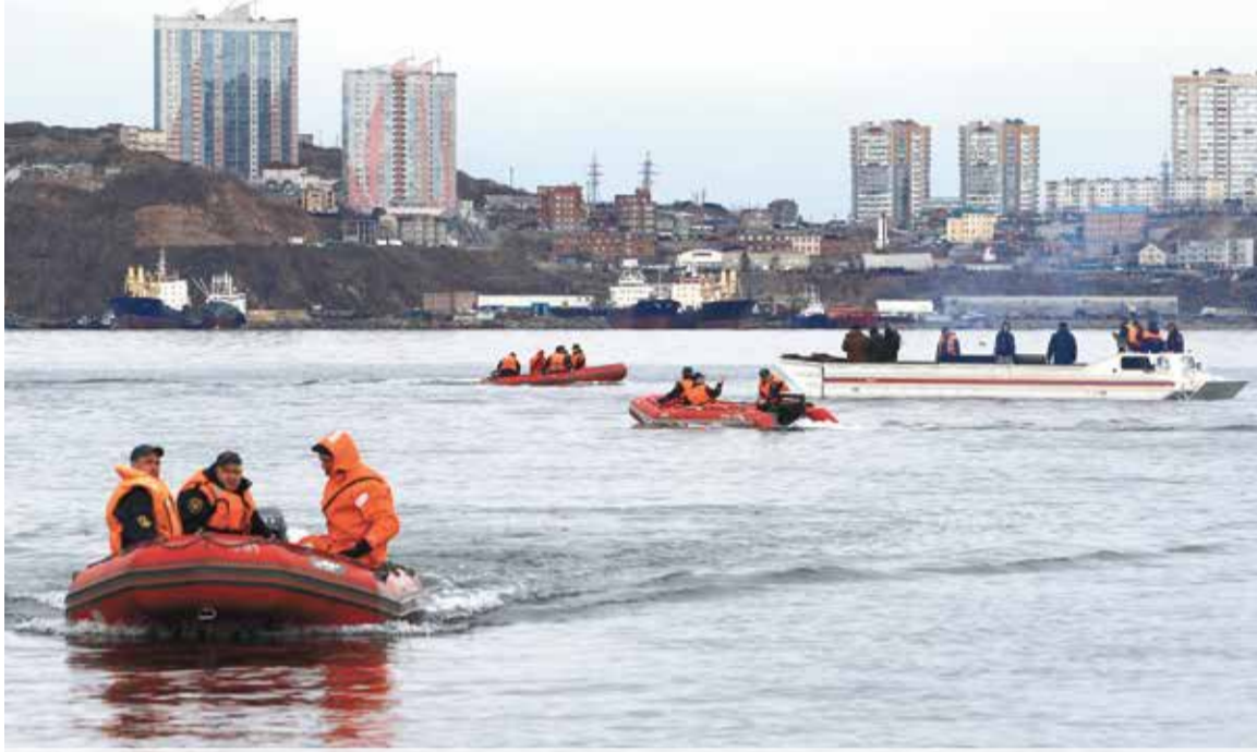
Приморские спасатели готовятся к противодействию весеннему паводку

Крупномасштабные учения прошли во всех регионах России. Подразделения МЧС и территориальные подсистемы РСЧС отработали порядок приведения в готовность к реагированию на ЧС.