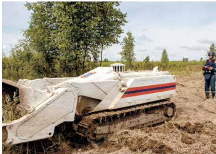
Пиротехники МЧС России используют роботов для разминирования

тогда были неспособны выполнить задачу по спасению шахтеров в аварийной шахте в Норильске. В 2017–2019 годах у нас были попытки создания наземных РТК и БАС для работы в аварийных шахтах, но неудачные. Примерно в тот же период была ситуация и с неэффективным размещением контрактов по закупке комплексов. Сегодня, в условиях старения парка робототехни-