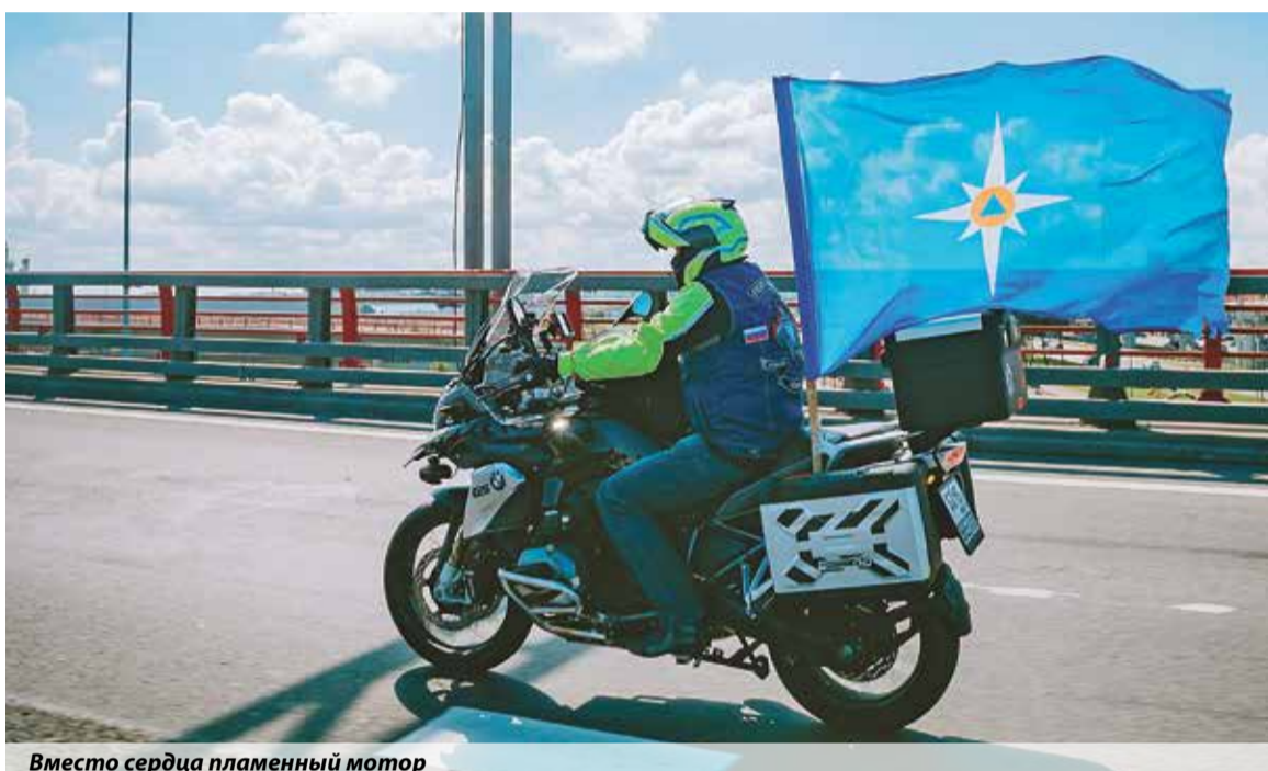
Вместо сердца пламенный мотор

Анастасия Трунцева, пресс-служба ГУ МЧС России по Москве