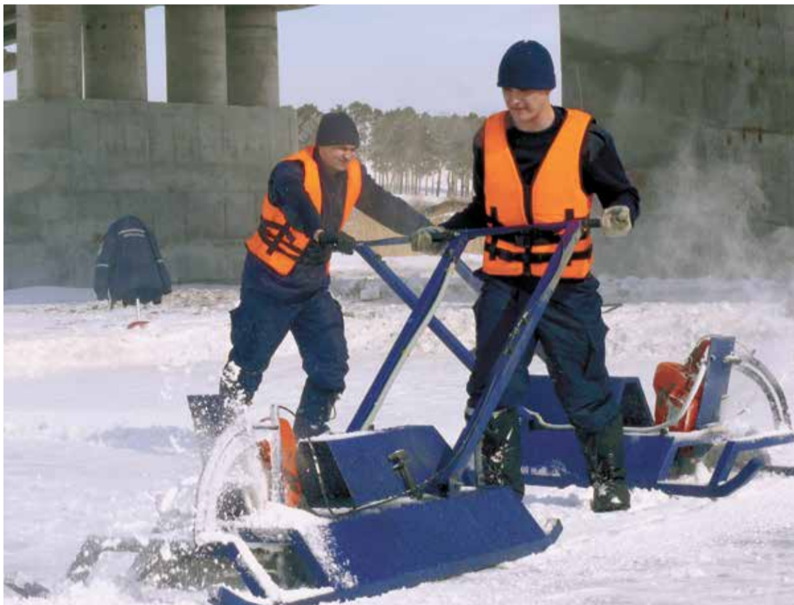
Распиловка льда остается одним из наиболее надежных методов предотвращения заторов

На территории 30 субъектов страны, по данным на 12 апреля, были отмечены подтопления в 34 населенных пунктах. Вода зашла на 706 приусадебных участков, прервала передвижение на 87 мостах и 27 участках автодорог. Жизнеобеспечение людей не нарушалось за счет работы лодочных переправ, организованных силами МЧС России. При необходимости в населенные пункты доставлялись медицинские специалисты.