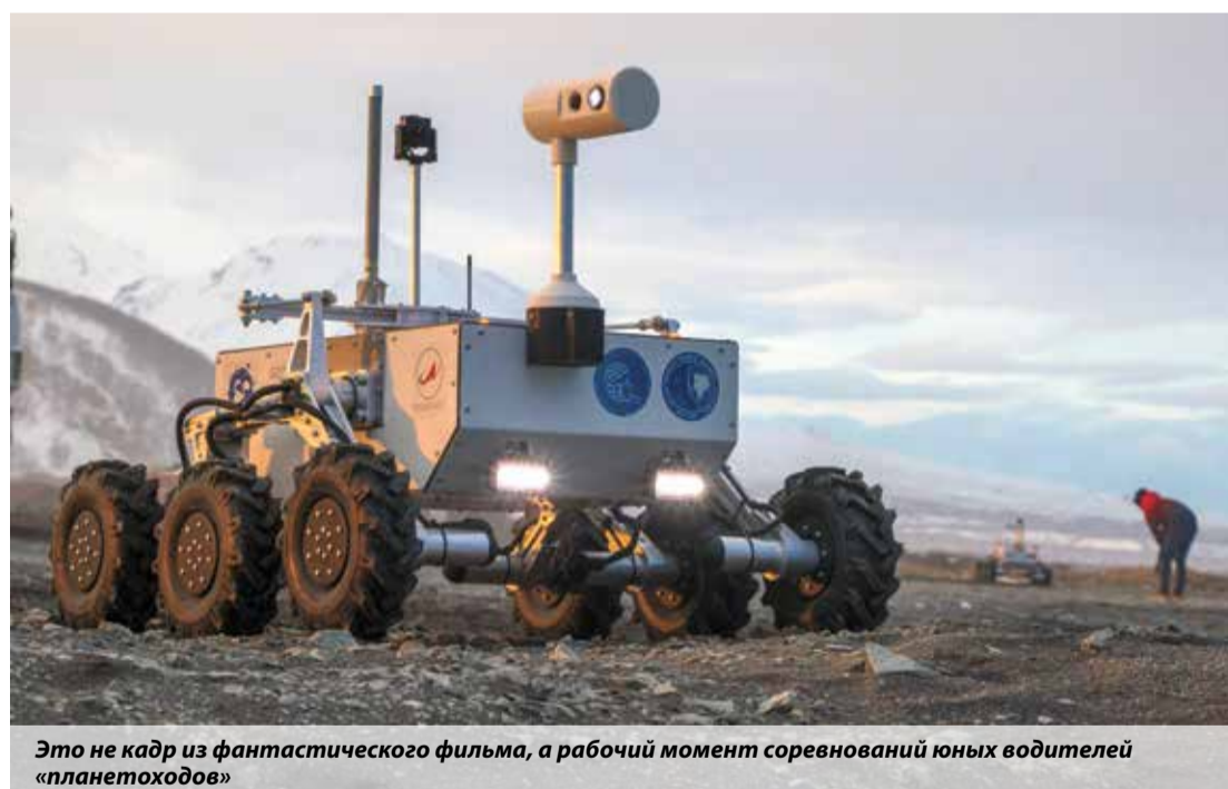
Это не кадр из фантастического фильма, а рабочий момент соревнований юных водителей «планетоходов»

Елена Левин, пресс-служба ГУ МЧС России по Камчатскому краю