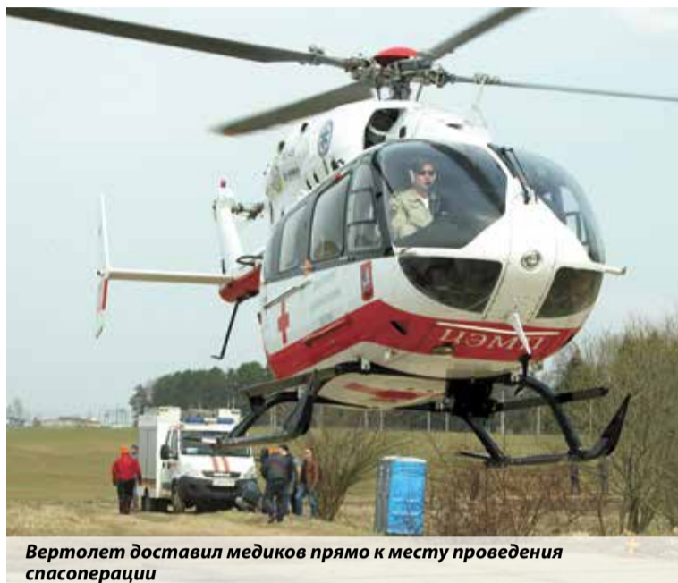
Вертолет доставил медиков прямо к месту проведения спасоперации

— Ежегодно в рамках общероссийской тренировки мы проводим учения на тер-