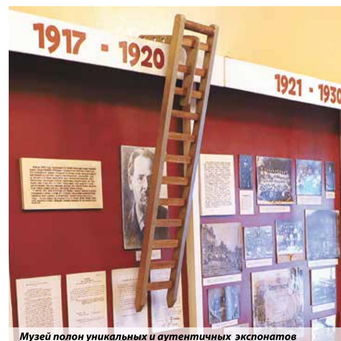
Музей полон уникальных и аутентичных экспонатов