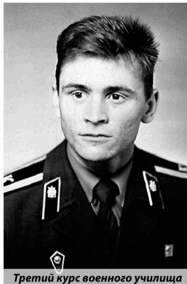
Третий курс военного училища