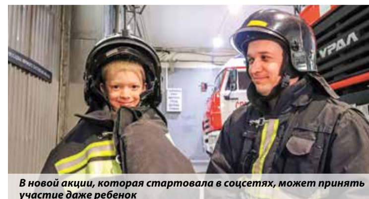
В новой акции, которая стартовала в соцсетях, может принять участие даже ребенок